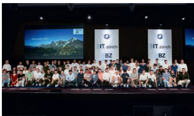
Les meilleurs diplômés de 2022