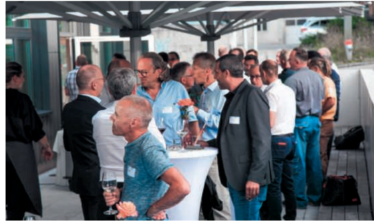
Cocktail dînatoire festif