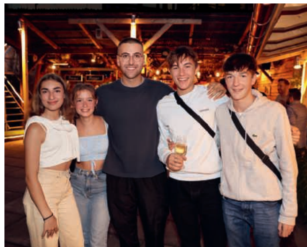
Les apprentis ont apprécié les échanges entre eux.