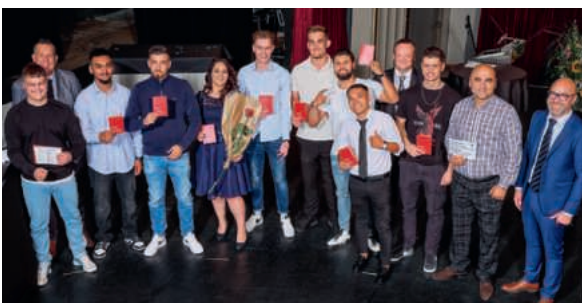
Quelques-uns des diplômé/es ayant réussi leur PQ