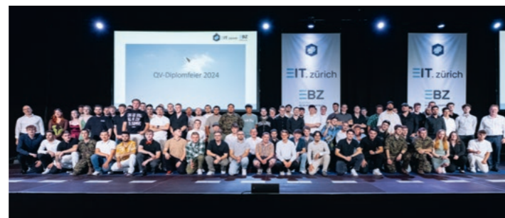
I migliori neodiplomati 2024