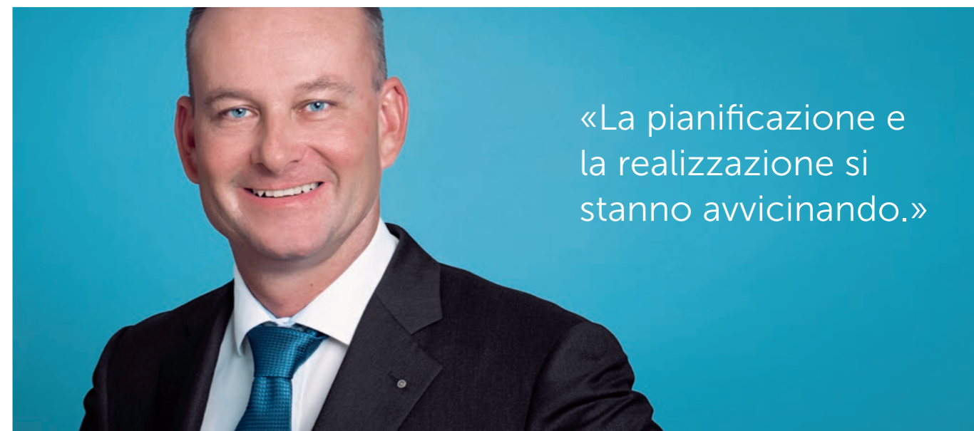
Foto a sinistra: © iStock (nadia), l'illustrazione di copertina: © Unsplash (Anders Jiliden)

«La pianificazione e la realizzazione si stanno avvicinando.»